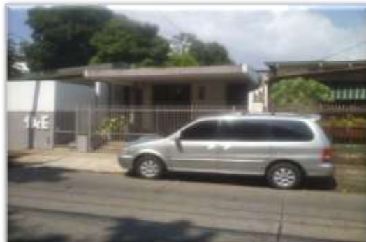
Residencia N°1 donde alojaban un grupo de víctimas de Trata de personas, Modalidad de Explotación Sexual

Luego de las diligencia de allanamiento, las 11 víctimas fueron referidas por orden de la fiscalía al centro de atención a la víctima, donde el personal idóneo de psicólogos sirven como auxiliares y guía a las mujeres que han sido víctima de este delito, luego son trasladadas al Instituto Nacional de la Mujer de Panamá, lugar que funciona como refugio temporal a las víctimas