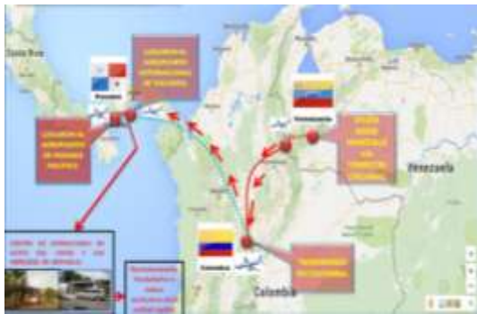
Rutas Terrestres y aéreas utilizadas para el transporte de víctimas que Inicia en Venezuela, Colombia hasta llegar a Panamá.