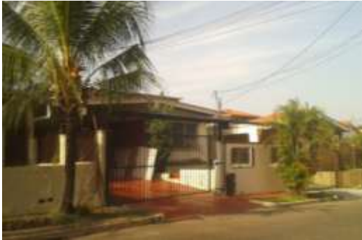
Residencia N°2 donde alojaban un grupo de víctimas de Trata de Personas, Modalidad de Explotación Sexual.